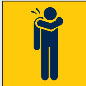
Nies- und Husten- etikette