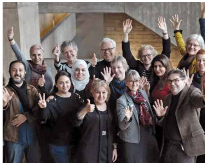
Glückwünsche des Landes und der Stadt Offenbach für die zweite WIR-Lotsengruppe des Freiwilligenzentrums.

Die örtlichen Integrationslotsenprojekte haben einen umfassenden und aktuellen Überblick über Angebote und Zuständigkeiten in ihrem Einzugsbereich und können Ratsuchende zielgenau weiterverweisen. WIR-Integrationslotsinnen und -lotsen vermitteln dabei zwischen den Bedürfnissen der Ratsuchenden und den Anforderungen und Möglichkeiten der Ämter und Fachdienste. Sie kennen aber auch die Vereinsstrukturen (wie z. B. Sportverein, Freiwillige Feuerwehr, Frauenschwimmen und -turnen, Musikverein, Laientheater, Mütterzentren) und können so in passende Freizeitaktivitäten vermitteln.