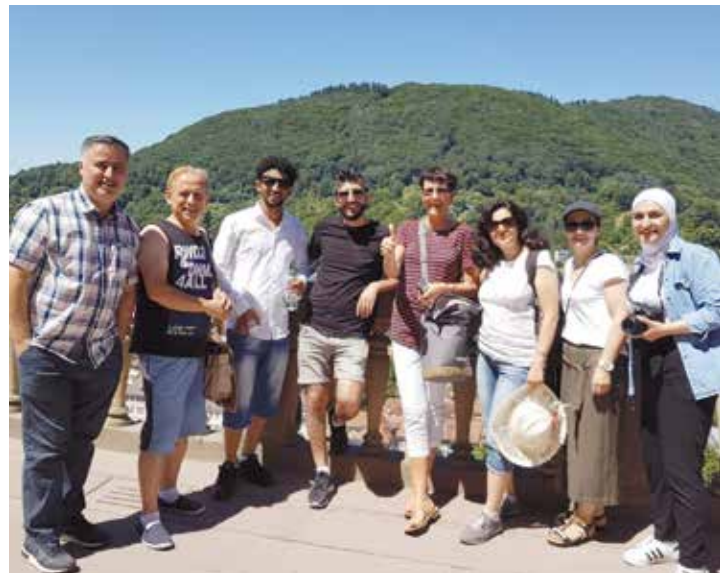
Die Lotsenteams aus Rodgau und Seligenstadt bei einem gemeinsamen Ausflug in Heidelberg.

Die Themen für Vertiefungsschulungen können gemeinsam mit aktiven WIR-Integrationslotsinnen und -lotsen gesammelt werden, um die tatsächlichen Bedarfe abzufragen.