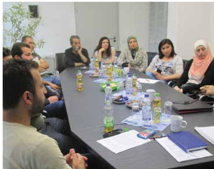
Intensiver Austausch der Integrationslotsinnen und -lotsen in Wetzlar beim Freiwilligenzentrum Mittelhessen.