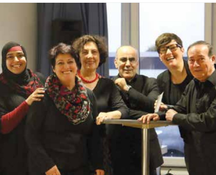
10 Jahre WIR-Integrationslotsinnen und -lotsen in Hattersheim – ein Grund, stolz zu sein.

Die Mitwirkung in einem WIR-Integrationslotsenprojekt eröffnet den ehrenamtlich Engagierten selbst vielfältige Möglichkeiten der persönlichen Weiterentwicklung. Zu nennen sind hier der Einsatz und die Weiterentwicklung vorhandener und der Erwerb neuer Kompetenzen, der Einblick in die Arbeit von Ämtern, Fachdiensten und sozialen Initiativen, in die (Aus-)Bildungsstruktur, das Gesundheitssystem. Ein weiterer Aspekt ist die Möglichkeit, neue soziale Kontakte zu knüpfen.