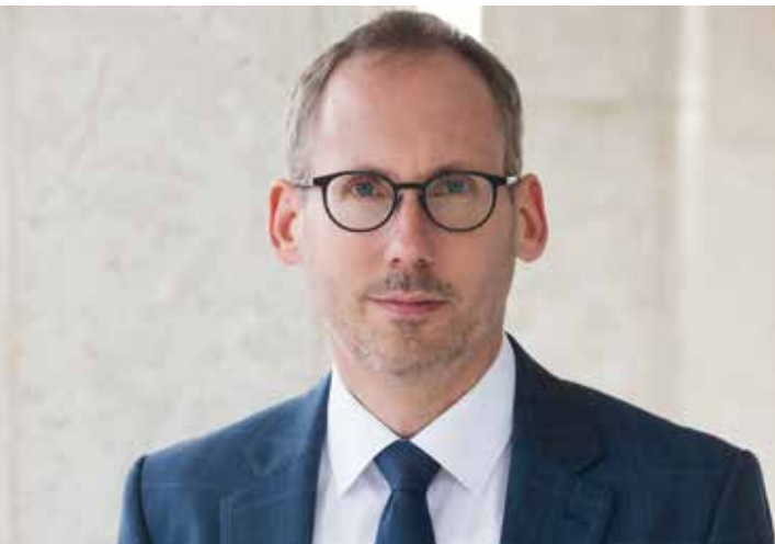
Kai Klose Staatsminister für Soziales und Integration