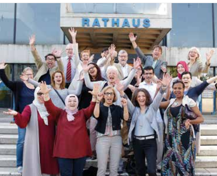
Große Freude vor dem Offenbacher Rathaus, die erste WIR-Lotsengruppe des Freiwilligenzentrums ist qualifiziert.

Lernprozesse können auf unterschiedlichen Wegen vorangetrieben werden. Zunächst sind hier die im Rahmen des Landesprogramms WIR förderfähigen Vertiefungsseminare zu nennen. An vielen Projektstandorten gibt es darüber hinaus weitere Bildungsangebote, die für das Engagement als WIR-Integrationslotsin oder -lotse von Belang sind. Die Nutzung solcher Bildungsangebote ist eine gute Möglichkeit der Reflexion und (persönlichen) Weiterentwicklung (→ S. 14).